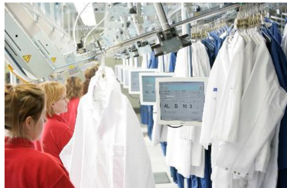
Contrôle de la qualité des vêtements de travail