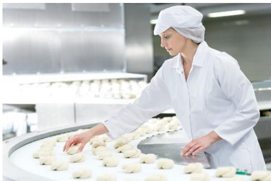
Vêtements hygiéniques : dans les entreprises MEWA, on travaille selon le système RABC

Suivre MEWA sur Twitter : www.twitter.com/mewa_be