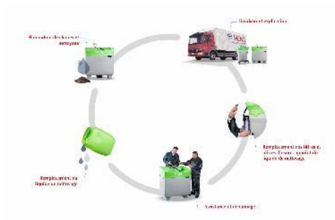
Le service global de MEWA : nettoyage de pièces avec un système