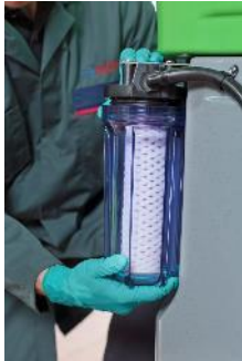
Fontaine de dégraissage MEWA Bio-Circle : remplacement du filtre