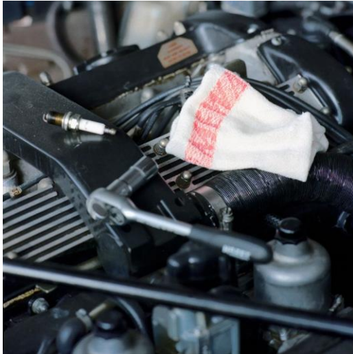
MEWATEX poetsdoeken: klaar voor het vuile werk.