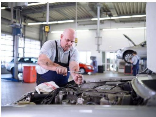
Poetsdoeken van MEWA altijd binnen handbereik.