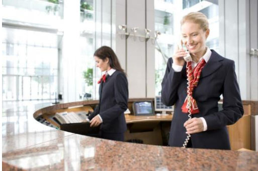
MEWA hemd- en blouseservice aangevuld met mantelpakjes