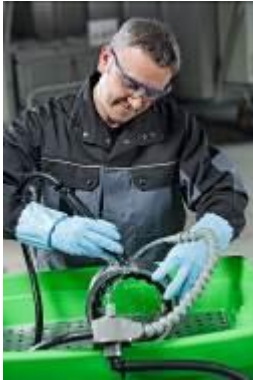
MEWA Bio-Circle: veilig en doeltreffend, ook voor aluminium.