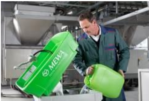
MEWA Bio-Circle: met ecologische reinigingsvloeistof.