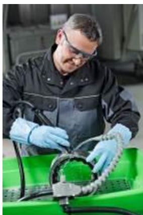
MEWA Bio-Circle : sûr et efficace, également pour l'aluminium.