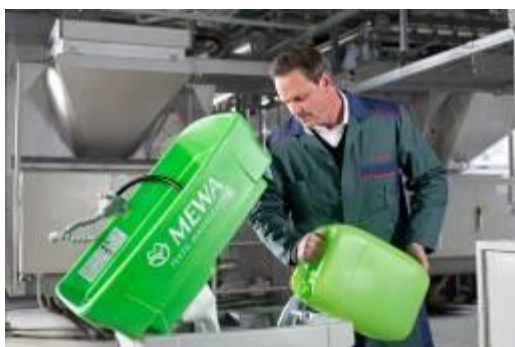
MEWA Bio-Circle : avec un liquide de nettoyage écologique.