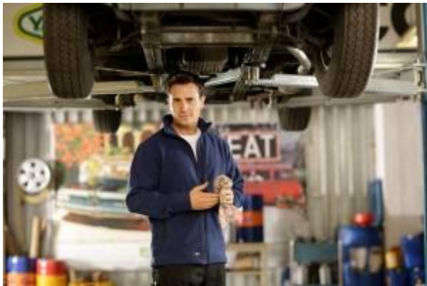
Aangenaam licht: Korsar Crossover fleecvest