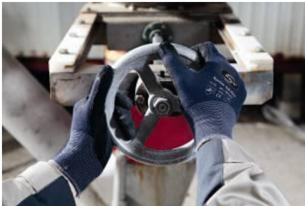
Korsar stoffen veiligheidshandschoenen met latexlaag zijn vochtwerend en grijpvast