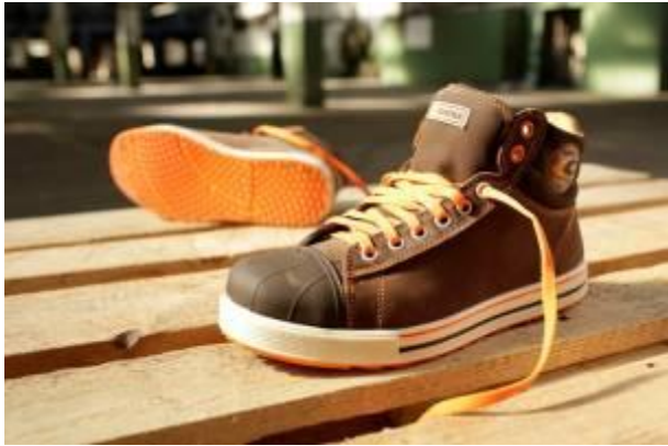
Sportieve veterschoenen klasse 3 met metaalvrije doortrapbescherming