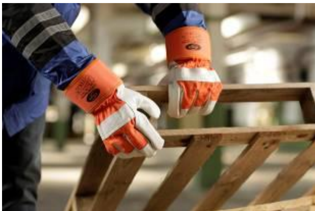
Handen beschermen tegen mechanische kwetsuren: Korsar veiligheidshandschoenen uit leder zijn verkrijgbaar in diverse kleuren