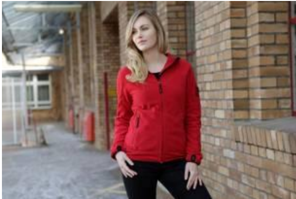
Getailleerde Crossover fleecvest met kap voor dames van Korsar