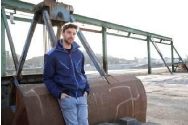
Softshell pilootvest van Korsar