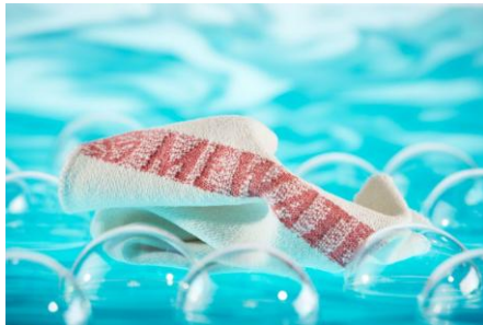
MEWA-poetsdoeken: professioneel gewassen