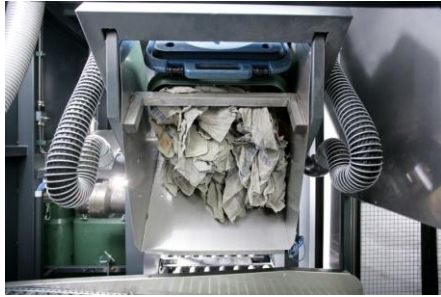
MEWA-poetsdoeken: uit de SaCon, in de was