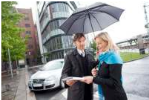
Beschut tegen weer en wind: MEWA-mantels in businesslook