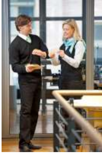
Perfect trendy gekleed: MEWA breidt assortiment businesskleding uit