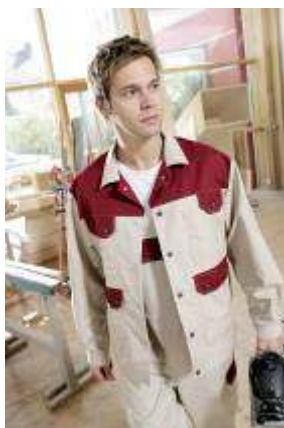
MEWA Twinstar ...