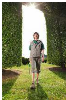
... Generation Work