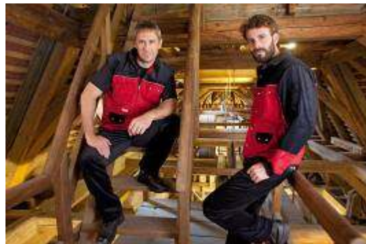
... MEWA Combistar