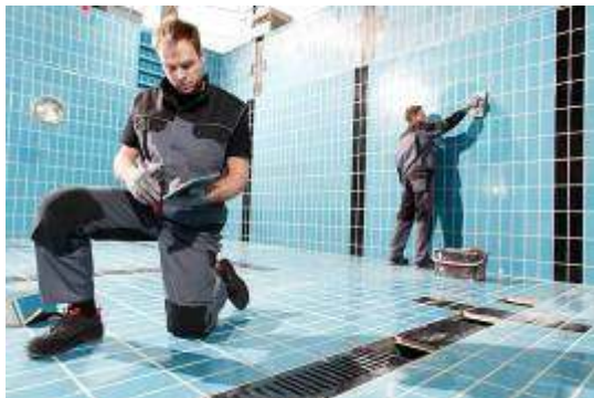
MEWA Performance ...

MEWA kleedt bedrijven vanaf één medewerker en biedt verschillende collecties: