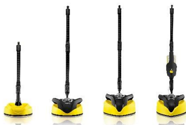
De 4 modellen van het nieuwe Kärcher-assortiment oppervlaktereinigigers

Kärcher b.v. – Postbus 9358 – 4801 LJ Breda Kenneth Wagtmans – kenneth.wagtmans@nl.karcher.com Tel. : +31 76 75 01 700 - Fax : +31 76 75 01 751 - www.karcher.nl