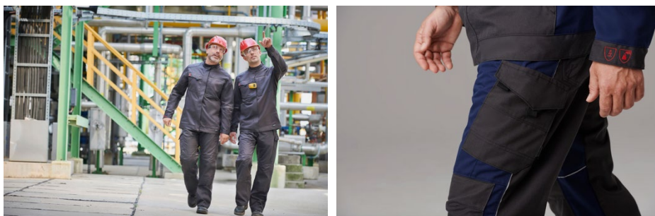
Moderne ontwerpen maken PBM's steeds aantrekkelijker.

Als de risico's hoog zijn en de veiligheidsnormen het voorschrijven, moeten persoonlijke beschermingsmiddelen (PBM's) altijd en overal gedragen worden. Eens de juiste beschermende kledingstukken uitgekozen en aangeschaft, zien werkgevers erop toe dat ze ook duurzaam worden ingezet op de werkvloer. Moderne designs en comfortabele ontwerpen zorgen er alvast voor dat PBM's steeds bewuster worden gedragen.