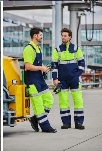
Ergonomische snitten en comfortabele hightechstoffen verbeteren het draagcomfort van beschermende kleding aanzienlijk.