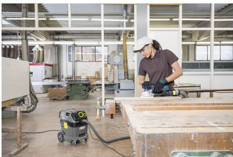
De nieuwe generatie nat- en droogzuigers met Tact-systeem voor filterreiniging garandeert een stofvrije werkomgeving.