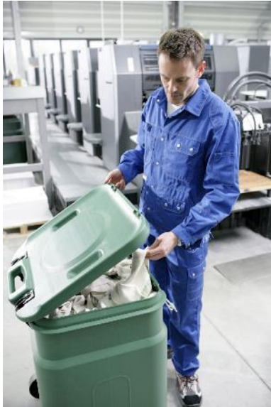
De herbruikbare poetsdoeken van MEWA worden bewaard in de SaCon veiligheidscontainer